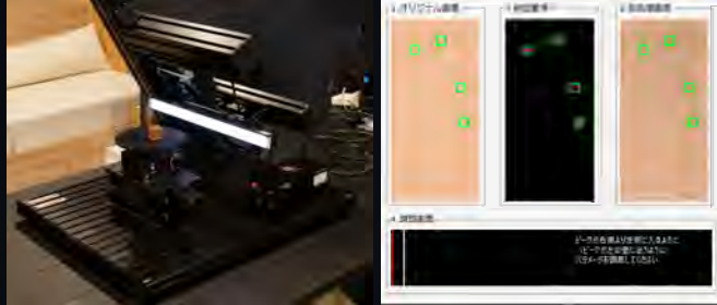
汎用外観検査装置「IKZ-01」

弊社のもつ AI・画像処理技術を駆使して工場等での外観検査の自動化を行い、省人化・生産コスト削減を実現いたします。