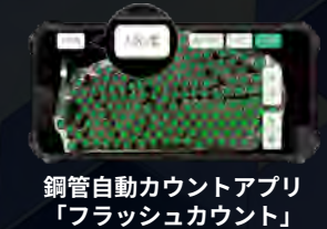
鋼管自動カウントアプリ「フラッシュカウント」