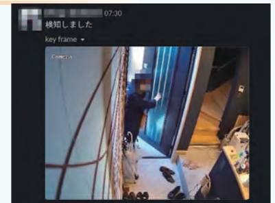
スマートフォン・タブレットへの通知機能

対象物を検知した際に、スマートフォンやタブレット端末へのリアルタイム通知が可能です。また、画像とともにチャットツールや SNS と連携して通知を行うこともできます。タイムスタンプも押されているため、勤怠管理としてのご活用もいただけます。