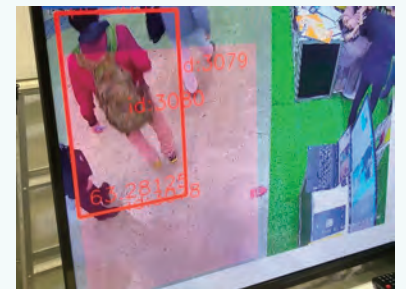
エリア検出機能 (赤い部分のみ検出)

初期設定の状態でも、人間や自動車など基本的な物体の検知機能を搭載しておりますが、検知したいもののデータを集めて学習させることで、オリジナルの検知する対象物を追加することができます。